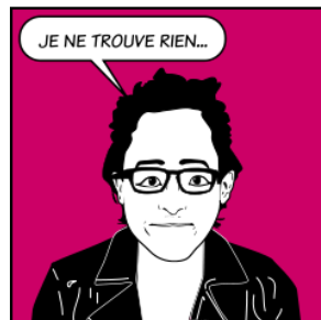
Un étudiant visiblement préoccupé.

De passage à la bibliothèque, les étudiants n’hésitent plus à nous faire part de leurs recherches en cours et des difficultés rencontrées. L’un d’eux est ainsi venu me voir visiblement préoccupé :